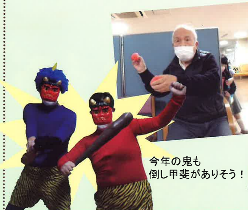
今年の鬼も 倒し甲斐がありそう！

2月3日は毎年恒例！楽しい楽しい節分イベント。今年も盛り上がりました。鬼に扮した職員が低い声で笑いながらノツシノツシとフロアに登場！待ち受けるのはご利用者の皆様。思いっきり「鬼は外！福は内！」と豆を投げまくりました。しっかりと邪気を払って今年も皆様にたくさんの福が訪れますように！