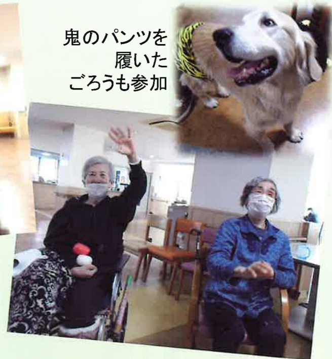
鬼のパンツを履いた ごろうも参加