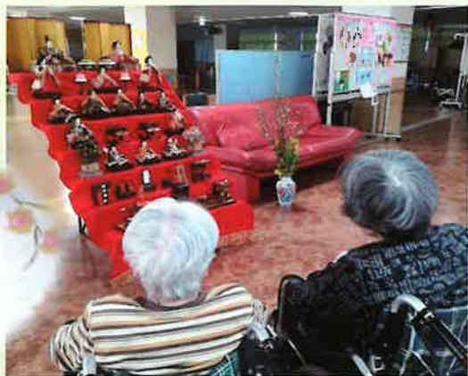
雛人形のおやつ菓子

春の陽気を存分に感じていただき、「桜がきれい！」「気持ちいい！」ととても喜ばれていました。やっぱり桜は最高です！