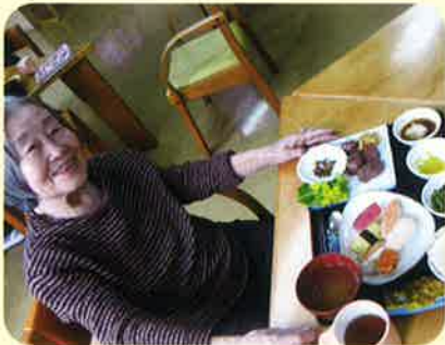
好きな料理が並ぶと自然と微笑がこぼれます。