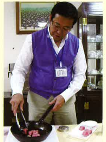
こだわりの一品は施設長自ら腕をふるいます。

「〇〇さん、もうすぐお誕生日になりますが、〇〇さんが今、一番召し上がりたい食べ物はなんですか？」「私はお魚が好きだからお寿司が食べたいわ。でもお肉もいいわね～。デザートも頼める？」これは、とあるフロアでのご利用者様と職員とのやりとりです。始めてから3ヶ月がたちましたが、ご利用者様・ご家族様からご好評頂いています。今日も東へ西へご利用者様のご期待に応える為、食材探しの旅は続く…。