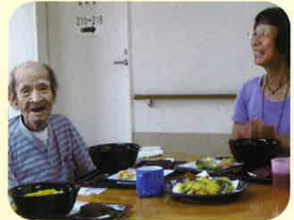
大好きな天ぷらとうどんをお腹いっぱい頂きました。

今年度の新たな取り組みとして「お一人おひとりに喜んでいただけるお食事」を目標にした「お誕生日食」を始めました。ご利用者様やご家族様から「食べたい料理」や「思い出の一品」などのご希望を伺い、その方の特別な日に、特別な食事を召し上がっていただいております。