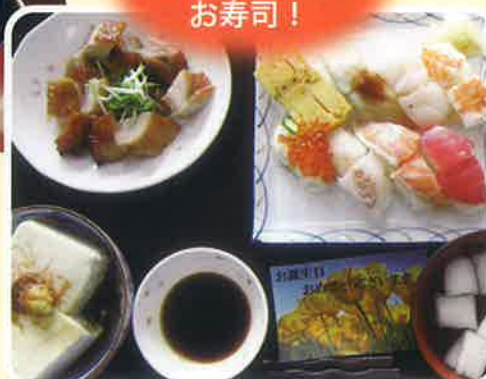
リクエストNo.2 お寿司！