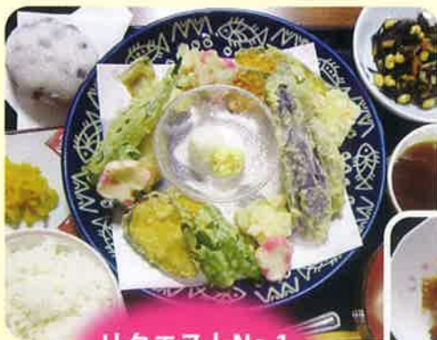
リクエストNo.1 天ぷら！