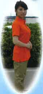
胸には法人のロゴが刺繍されています。