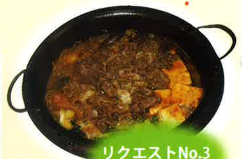
リクエストNo.3 すき焼き！