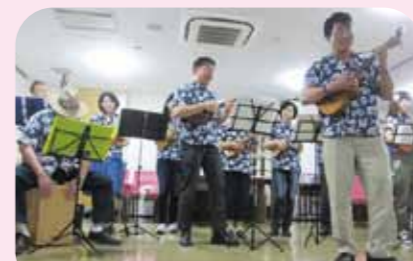
ハワイ民族音楽研究部様

ボランティアさんによるコンサートを開催し、さまざまなジャンルの演奏をウクレレやフルートの優しい音色で披露していただき、楽しいひとときを過ごしました。