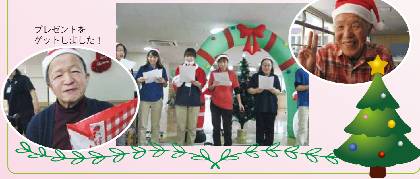
プレゼントをゲットしました！

今年のクリスマス会では、ビンゴゲームとクリスマスソング「赤鼻のトナカイ」「きよこの夜」を合唱しました！ビンゴゲームではプレゼント景品が当たるので、皆さん真剣に参加して、とても盛り上がりました！