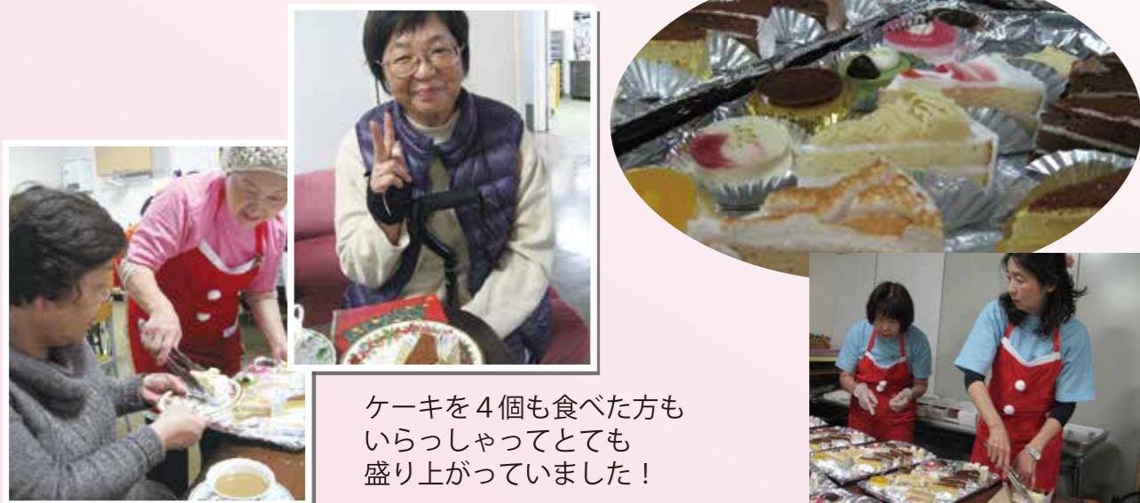
ケーキを4個も食べた方もいらっしゃってとても盛り上がっていました！

ご利用様が楽しみにしている年に一度のケーキバイキング！彩りあざやかで豊富な種類のケーキをご用意しました。どのケーキを食べようと迷っている様子も楽しそうでした。また来年も楽しみにしてくださいね。