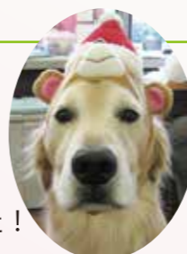
ごろうも参加しました！

今年のクリスマス会では、ビンゴゲームとクリスマスソング「赤鼻のトナカイ」「きよこの夜」を合唱しました！ビンゴゲームではプレゼント景品が当たるので、皆さん真剣に参加して、とても盛り上がりました！