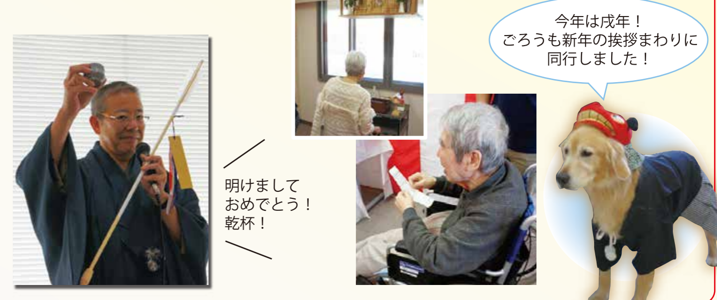
明けましておめでとう！乾杯！

ご利用者の皆様、職員一同、無事に平成30年を迎えることが出来ました。元旦に佐原神社へ初詣に行き「おみくじ」で今年の運勢を占いました。今年も皆様にとって良い年でありますように職員一同願っております。